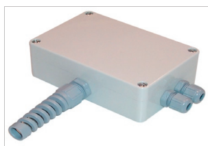
Samleboks for 2 - 4 vejeceller