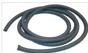
Panserslange til beskyttelse mod gnaver-angreb