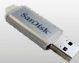
USB - NØGLE