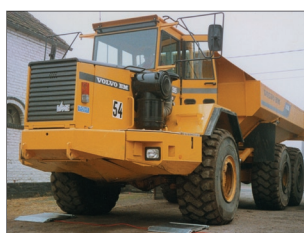
Vejning: aksel for aksel