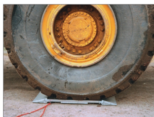
Lille og flexibel vejplade