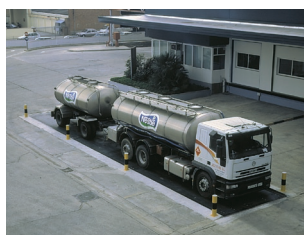
Alternativ til brovægt